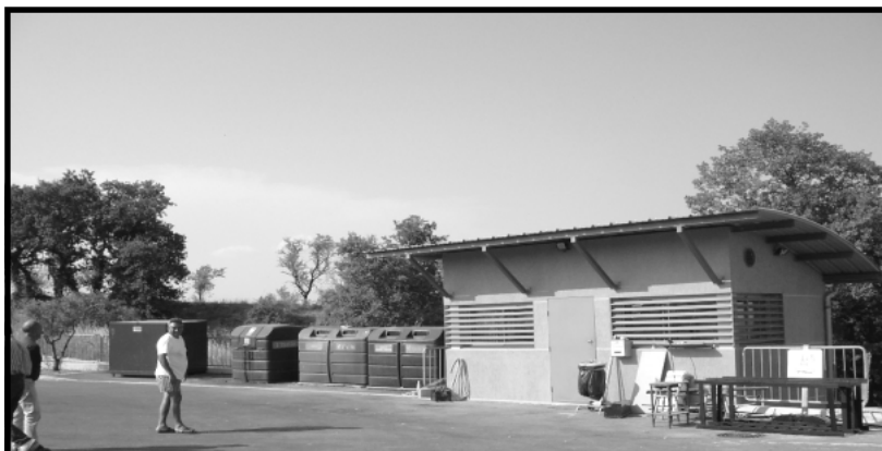
Une vue de la déchetterie pour ceux qui ne la connaissent pas encore...

Il suffit de s'y rendre pour y constater que la plupart des encombrants que l'on peut trouver chez un particulier peut y être