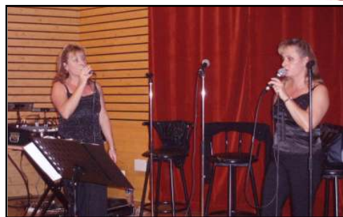
Les chanteuses de l'association "Abbyss".

Pour les absents et les nouveaux gajonais qui ne connaissent pas encore le jumelage, voici le texte du discours que j'ai prononcé à cette occasion :