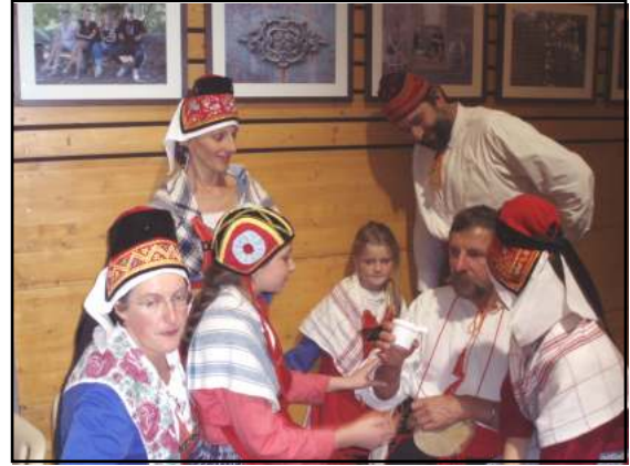
Le groupe folklorique "La Bethmalaise".