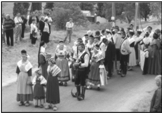
Folklores ariégeois et provençal réunis.

Après quelques arrêts sur les Places de la Porte